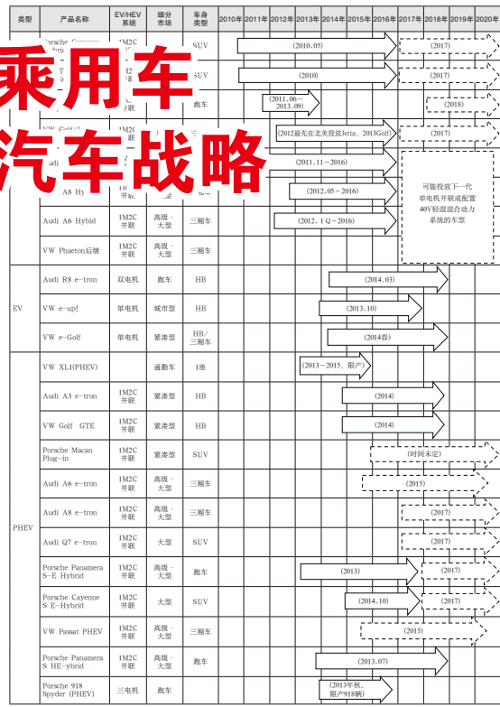
【大众集团 主要电动汽车产品投放时间和计划】